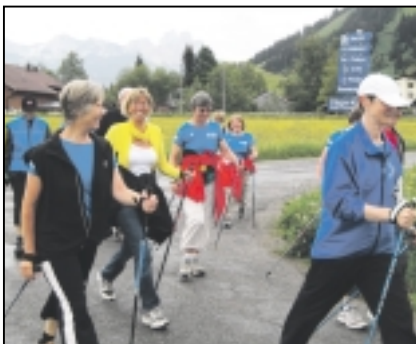
Gut gelaunte Nordic Walker beim Training

Das 10jährige Bestehen der Partnerschaft waren Idee und Motivation, einen Staffellauf von Alling nach Lannach durchzuführen. An der Organisation und Realisierung beteiligen sich aus beiden Gemeinden 40 Läufer, betreut von einem Service- und Küchenteam, aufgeteilt auf 10 Wohnmobile. Je ein Allinger und ein Lannacher Jogger oder Nordic Walker werden gemeinsam eine Stunde laufen/walken, dann wird gewechselt. Gelaufen