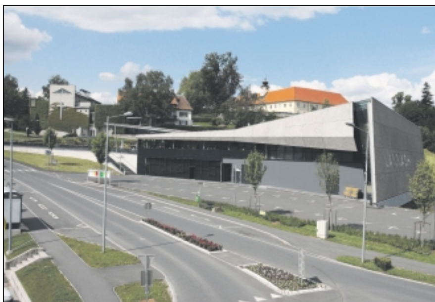
Die Lannacher Steinhalle

Wir freuen uns, wenn Ihr zum Festwochenende mitkommt: Neben der kostenfreien Busfahrt bieten Euch die Lannacher kostenfreie Übernachtung (in der Turnhalle) an! Die Lannacher Jugend freut sich auf Euch und ist dabei, ein Programm für Euch zu gestalten: Lasst Euch überraschen! Das kann jedoch nur klappen, wenn genug von den Allinger jungen Leuten mitfahren.