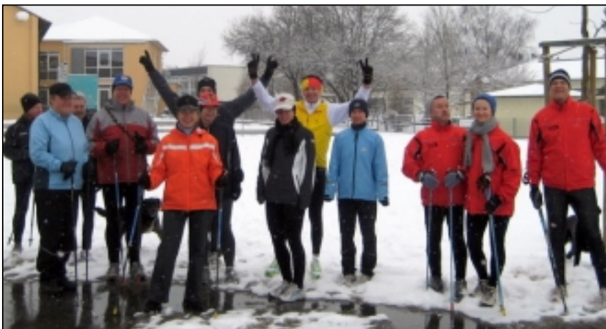
Bereits im Winter begann die intensive Trainingsvorbereitung