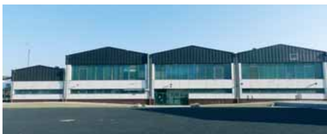
Außenansicht alt ...

Schon fast haben wir vergessen, wie sie vor der Sanierung ausgesehen hat: Im Jahr 1975 entstand die Mehrzweckhalle mit Stüberl, als zentrale Sport- und Kulturstätte, und leistete den Vereinen, der Schule und allen Bürgern sehr gute Dienste. Nach mehr als drei Jahrzehnten war sie nicht nur optisch „in die Jahre gekommen“. Eine grundlegende energetische Sanierung und intensive Wärmedämmung wurde notwendig. Sich ändernde Bedürfnisse und Wünsche der Sport- und Kulturvereine sowie der Schule erforderten eine neue Konzeptionierung und Erweiterung. Im Jahr 2009 beantragte die Gemeinde finanzielle Mittel aus dem Konjunkturpaket für die Hallensanierung – leider ohne Erfolg. Nach zwei weiteren Jahren eisernen Sparens konnte die Gemeinde dann 2011 aus eigener Finanzkraft das Projekt „Sanierung, Modernisierung und Erweiterung der Sporthalle“ starten: Fachkundig und lösungsorientiert begleitet wurden die Baumaßnahmen von dem Kreativteam, bestehend aus Gemeinderatsmitgliedern verschiedener Fraktionen, unserem Hausmeister, den Architekten, unserem Bürgermeister und dem Kämmerer der Gemeinde. Ein attraktiver Anblick in der Ortsmitte ist die