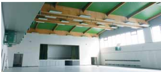
Innenansicht alt ...

Schon fast haben wir vergessen, wie sie vor der Sanierung ausgesehen hat: Im Jahr 1975 entstand die Mehrzweckhalle mit Stüberl, als zentrale Sport- und Kulturstätte, und leistete den Vereinen, der Schule und allen Bürgern sehr gute Dienste. Nach mehr als drei Jahrzehnten war sie nicht nur optisch „in die Jahre gekommen“. Eine grundlegende energetische Sanierung und intensive Wärmedämmung wurde notwendig. Sich ändernde Bedürfnisse und Wünsche der Sport- und Kulturvereine sowie der Schule erforderten eine neue Konzeptionierung und Erweiterung. Im Jahr 2009 beantragte die Gemeinde finanzielle Mittel aus dem Konjunkturpaket für die Hallensanierung – leider ohne Erfolg. Nach zwei weiteren Jahren eisernen Sparens konnte die Gemeinde dann 2011 aus eigener Finanzkraft das Projekt „Sanierung, Modernisierung und Erweiterung der Sporthalle“ starten: Fachkundig und lösungsorientiert begleitet wurden die Baumaßnahmen von dem Kreativteam, bestehend aus Gemeinderatsmitgliedern verschiedener Fraktionen, unserem Hausmeister, den Architekten, unserem Bürgermeister und dem Kämmerer der Gemeinde. Ein attraktiver Anblick in der Ortsmitte ist die