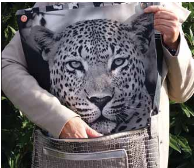
The Bag Concept: Kundinnen können sich ihre außergewöhnliche, unikate Tasche selbst kreieren.

Ich entwerfe und nähe Taschen, aus vielfältigsten Stoffen, in verschiedenen Größen, Farben, Formen. Klassisch, außergewöhnlich, glitzernd, mit Swarovskisteinen, Kunstfedern, Seide, Plissée und anderen spannenden Materialien. Jede ist ein individuelles Einzelstück. Ich bin immer auf der Suche nach dem Besonderen. In jedem Stoffladen